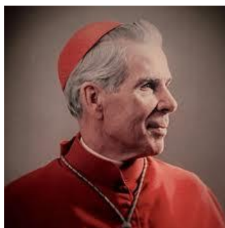
ABP FULTON J. SHEEN

Czym jest spowiedź? Nagością. Jest to nagość duszy. Spowiedź jest obnażaniem się ze wszystkich fałszywych wymówek i pozorów, i wszelkiego udawania; jest ukazaniem nas takimi, jakimi naprawdę jesteśmy.